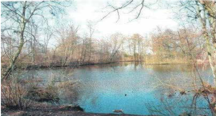
Søen i efterårs/vinterpåkledning.

Men for 70 år siden summede det af aktivitet ved søen. I årene efter krigen – fra 1945 og fire år frem, blev der gravet tørv – en erstatning for udenlandsk brændsel.