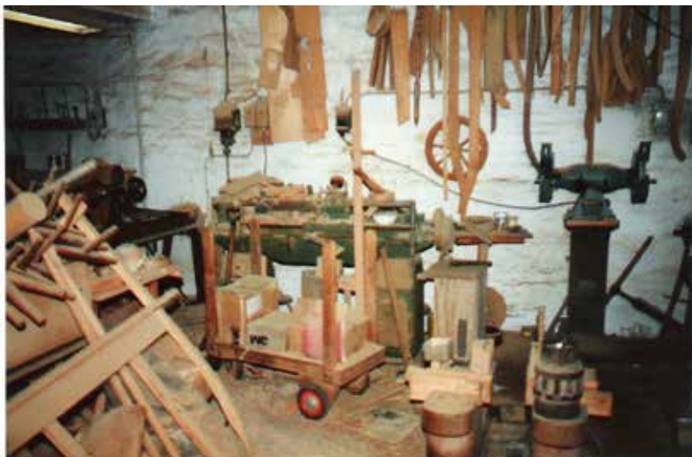
Optaget 1995.