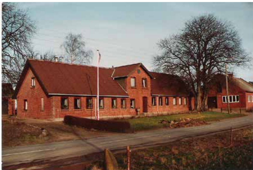
B597b. Søndergade 56. Optaget 2007.

I 1912 blev de 2 huse bygget sammen og der kom kvist på over det sammenbyggede stykke. I 1937 overtog karetmageren hele huset.