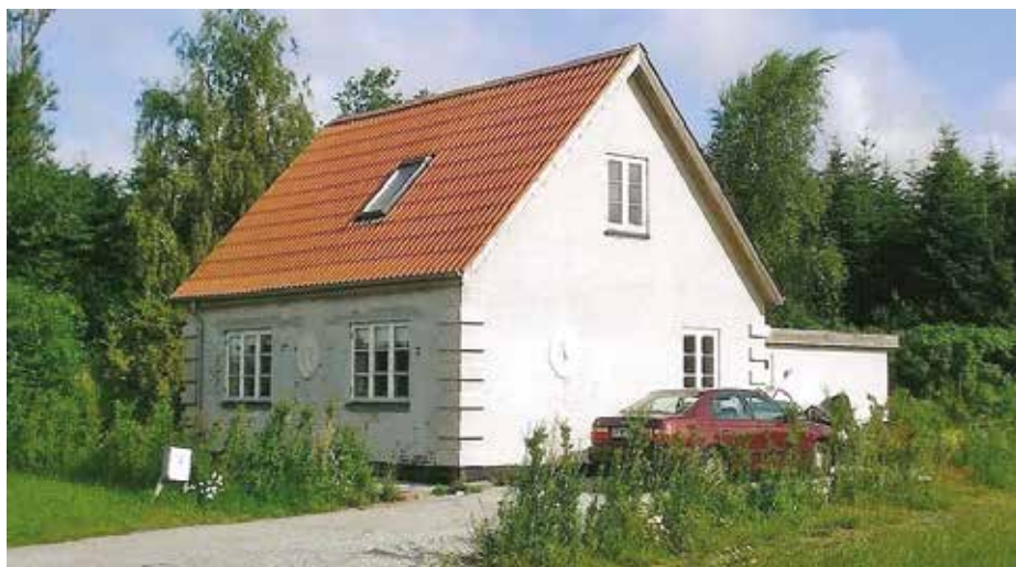
B2332. Husets udseende i 2012.