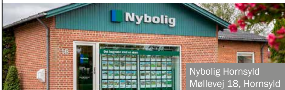
Nybolig Hornsyld Møllevvej 18, Hornsyld